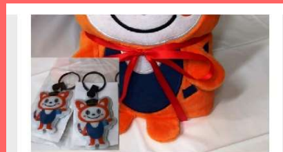
フランクセットとLEDライトをつけて思い思いの姿にカスタマイズ！