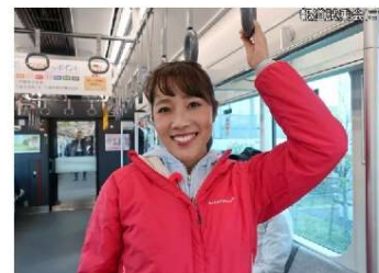
都心へのアクセスが便利！

相鉄・JR西武線は、都心への利便性向上を目指した相鉄のプロジェクトで、相鉄線西谷駅とJR東海貨物線横浜羽沢駅付近間に路線を新設、相鉄線とJR東海の相互直通運転を行うもので、これにより二俣川-新宿間が最短44分、海老名-武蔵小杉間が最短36分で短縮され、都心方面のアクセスが飛躍的に向上します。